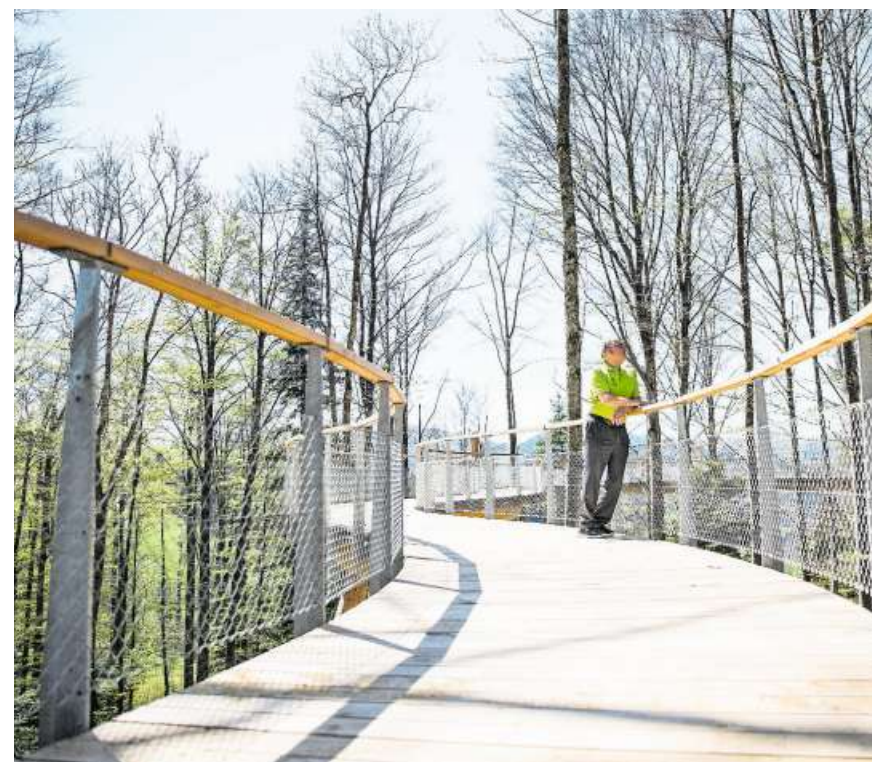
Werner Ackermann entschleunigt. Ein Leichtes auf diesem Weg.