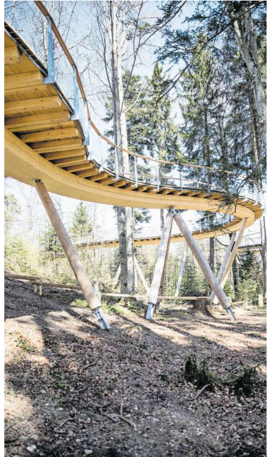
In immer gleichen Radien schlängelt sich der Baumwipfelpfad durch die Bäume.

Eröffnung: Auffahrtssonntag, 10. Mai. Weitere Informationen: www.baumwipfelpfad.ch .